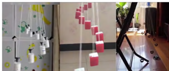
图 3 学生制作的蛇摆

和耐心调节的过程。因为此实验趣味性和实践性比较强,虽然调节有一定难度,但还是受到了学生的欢迎。有很多学生做出了非常漂亮的蛇摆(图 3)。居家实验教学也遇到难点问题,比如有的学生动手能力比较差,遇到问题有畏难情绪,家中可用材料不足,要自己考虑解决,学生不习惯这样的实验,遇到这些问题教师需要通过正确引导、耐心的讨论和指导和适当的鼓励帮助学生解决问题。